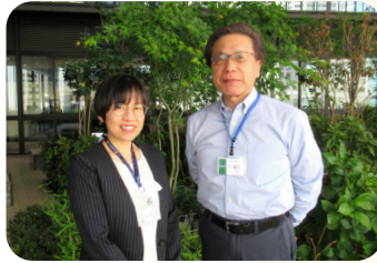
区社協 石古部長 区保健福祉部 尾西部長