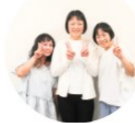
主催者のコメント

神戸市立こうべ小中学校で、食事に使う食材を栽培したり、グラウンドで遊んだり、地域の企業等とこども食堂を開催したり、地域でこどもの成長を見守ります。