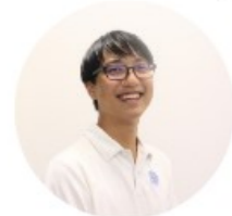
高校生リーダーのコメント

募金活動は困っている人へ直接支援できる活動です。創意工夫しながら大きな声で呼びかけました。